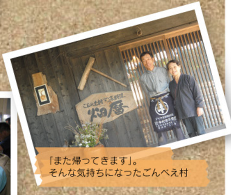
「また帰ってきます」。そんな気持ちになったごんべえ村