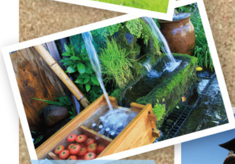
いつもより3倍おいしく 感じた湧水の冷やしトマト