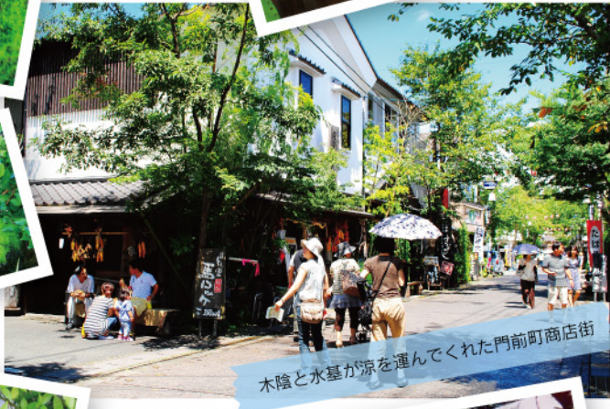
木陰と水基が涼を運ってくれた門前町商店街