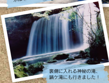
裏側に入れる神秘的滝、 鍋ヶ滝にも行きました！