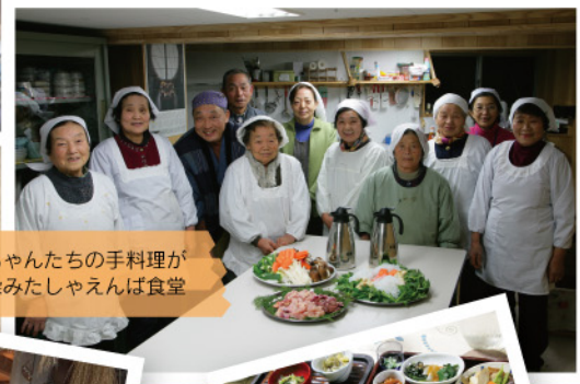
おばちゃんたちの手料理が心に染みたましゃえんば食堂